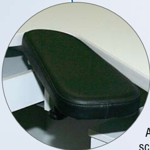
Armauflagen, beweglich in schwarzer Kunstlederoptik