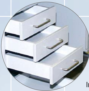
Schubladen mit optionaler Inneneinteilung