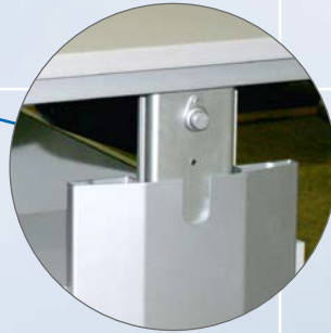
Elektrische Höhenverstellung von 95 - 145 cm