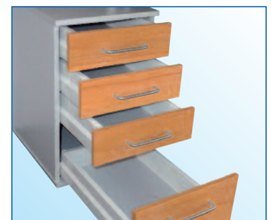
Schubladenführung mit Vollauszug und Softeinzug serienmäßig.