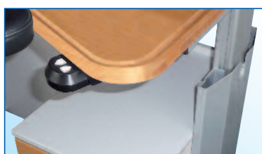
Elektrische Höhenverstellung von 95–145 cm (Uhrmachertisch) und von 85–135 cm (Goldschmiedetisch)