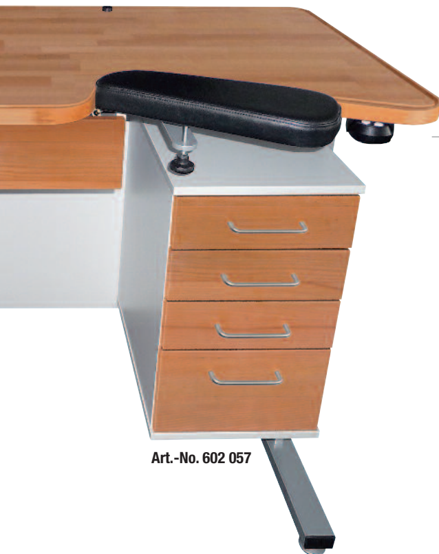
Art.-No. 602 057